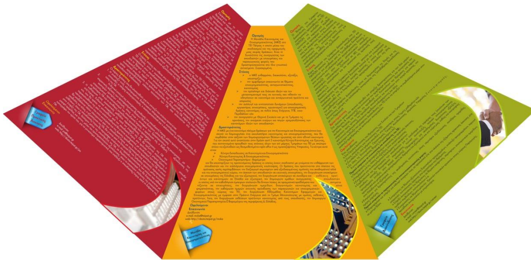
Εικόνα 3. Εσωτερική όψη ενημερωτικού φυλλαδίου

Η ίδια φιλοσοφία διέπει και την αφίσα του έργου (Εικόνα 4. Αφίσα ΔΑΣΤΑ ΤΕΙ Πατρών), η οποία περιλαμβάνει επιπλέον το σλόγκαν της Πράξης: «Η γέφυρα της εκπαίδευσης με την απασχόληση».