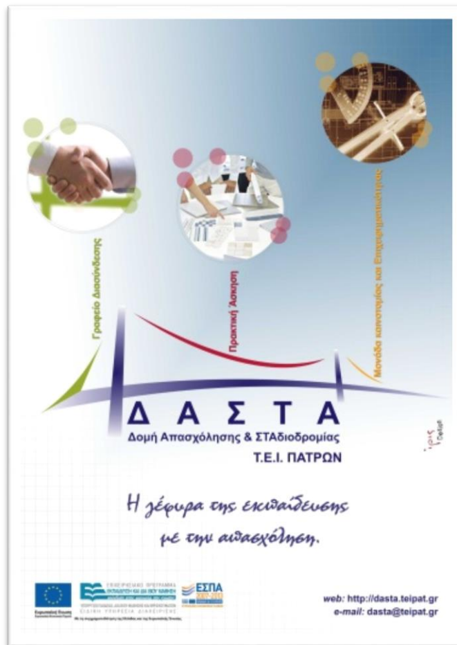
Εικόνα 4. Αφίσα ΔΑΣΤΑ ΤΕΙ Πατρών

Η ίδια φιλοσοφία διέπει και την αφίσα του έργου (Εικόνα 4. Αφίσα ΔΑΣΤΑ ΤΕΙ Πατρών), η οποία περιλαμβάνει επιπλέον το σλόγκαν της Πράξης: «Η γέφυρα της εκπαίδευσης με την απασχόληση».