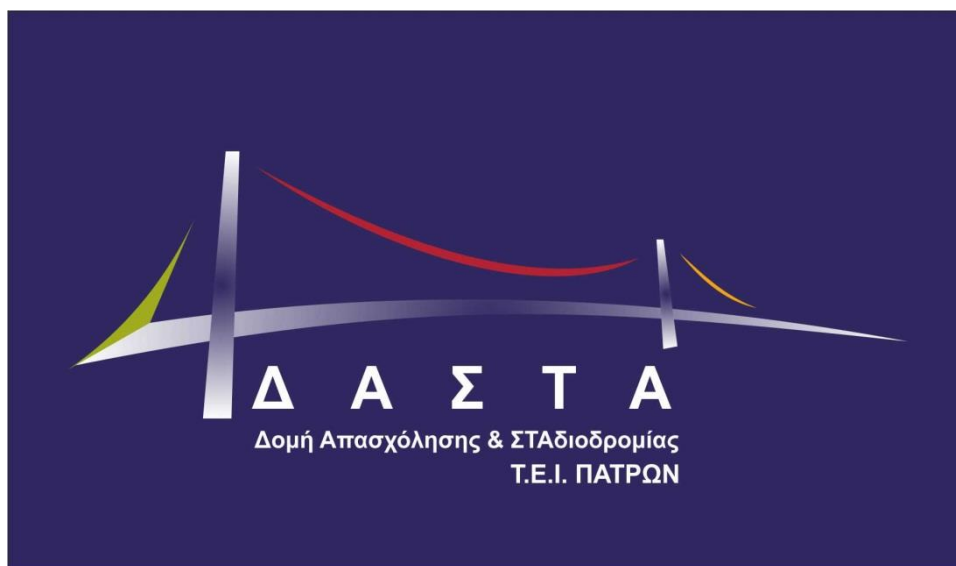
Εικόνα 1. Λογότυπο ΔΑΣΤΑ ΤΕΙ Πατρών

Αντίστοιχη χρωματική σύνδεση έχει γίνει και στα ενημερωτικά φυλλάδια του έργου (Εικόνα 3 και Εικόνα 3). Επιπλέον, στο τρίπτυχο φυλλάδιο, οι Πράξεις ΠΑ, ΓΔ και ΜΟΚΕ βρίσκονται εσωτερικά, ενώ ΔΑΣΤΑ αποτελεί την πρώτη όψη κατά το άνοιγμα. Το οπισθόφυλλο περιλαμβάνει τα λογότυπα του έργου και της αρχής χρηματοδότησης, αντίστοιχα. Στον εξώφυλλο, δεσπόζουσα θέση έχει η χρωματική σύνδεση της κάθε Πράξης με μία χαρακτηριστική οπτικοποίηση. Το κείμενο του φυλλαδίου για κάθε Πράξη ακολουθεί την ίδια δομή (βλ. αναλυτικό περιεχόμενο του φυλλαδίου στο Παράρτημα Ι: Περιεχόμενο ενημερωτικού φυλλαδίου) και περιλαμβάνει τις ενότητες: α) ορισμός, β) στόχος, γ) δραστηριότητες, δ) ωφελούμενοι, ε) επικοινωνία.