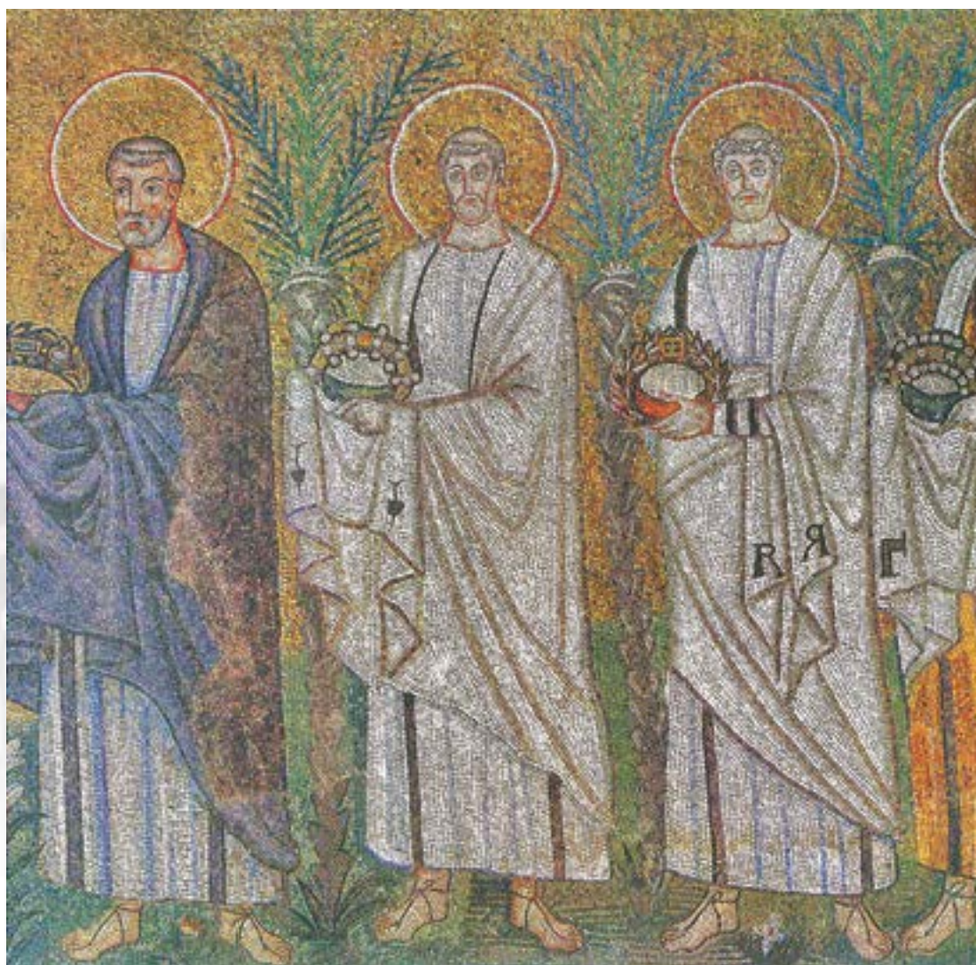
Πομπή αγίων μαρτύρων προσφερόντων δώρα, Άγιος Απολλινάριος ο Νέος, Ραβέννα, 556-565 Ν. Χατζηδάκη, Ελληνική τέχνη. Βυζαντινά ψηφιδωτά, Αθήνα 1994, εικ. 3.