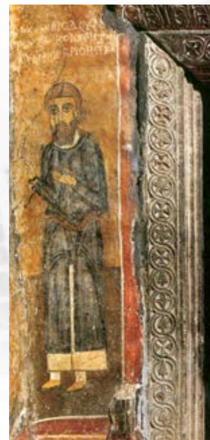
Ο δωρητής Κωνσταντίνος, Άγιοι Ανάργυροι, Καστοριά (γύρω στο 1000) Heaven and Earth. Cities and Countryside in Byzantine Greece, ed. J. Albani – E. Chalkia, 117 εικ. 97.