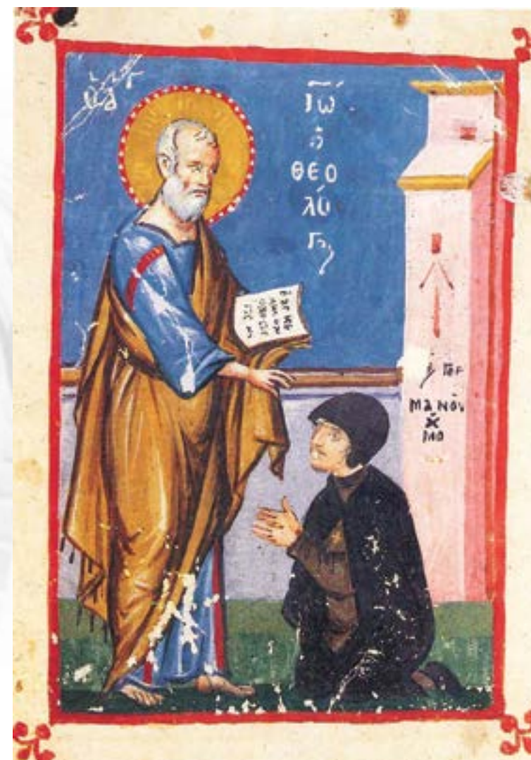
Ο ευαγγελιστής Ιωάννης και ο μοναχός Γερμανός, μικρογραφία, Sinaiticus gr. 1216 (γύρω στο 1250) Γ. Γαλάβαρης, Ελληνική τέχνη. Ζωγραφική βυζαντινών χειρογράφων, Αθήνα 1995, εκ. 201.

The application of modern tools such as the Social Network Analysis method will enable firstly the depiction of his ego-network on the base of all available sources (historical narratives, letters, Lives etc.). Moreover, we will be able to link not only Theodore the Stoudite with specific persons and places, but more important to distinguish between followers and opponents of Iconoclasm, as well as to register the linkages of these persons among them.