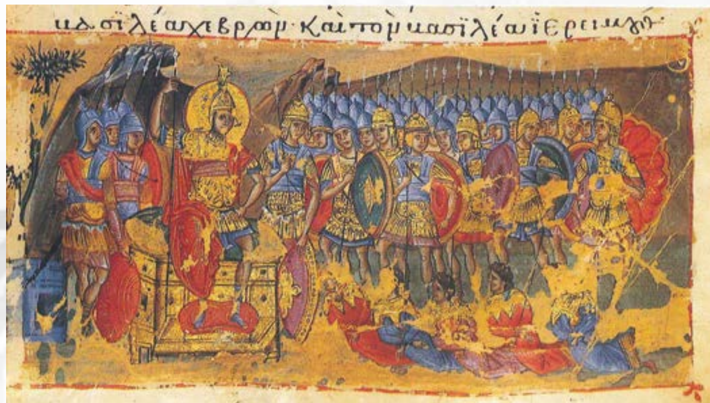
Οι Αμορραίοι βασιλείς προσκυνούν τον Ιησού του Ναυή, μικρογραφία, κωδ. Βατοπεδίου 602 (13ος αι.) Γ. Γαλάβαρης, Ελληνική τέχνη. Ζωγραφική βυζαντινών χειρογράφων, Αθήνα 1995, εικ. 193.

In the context of this workshop, this contribution intends to adopt a broad perspective and address the issue of perceptions of subalternity in medieval Byzantine society. The main focus will be on subaltern status as exclusion from the structures of social power, whereas special attention will be given to Romanness as a hegemonic political and cultural discourse. My aim is to look at the various reasons (socio-economic status, religious and ethno-linguistic identities, geographical position) that rendered certain groups of Roman subjects as powerless actors within society, but also to try and differentiate between various types and degrees of exclusion (or inclusion) of these groups from access to the dominant discourse.