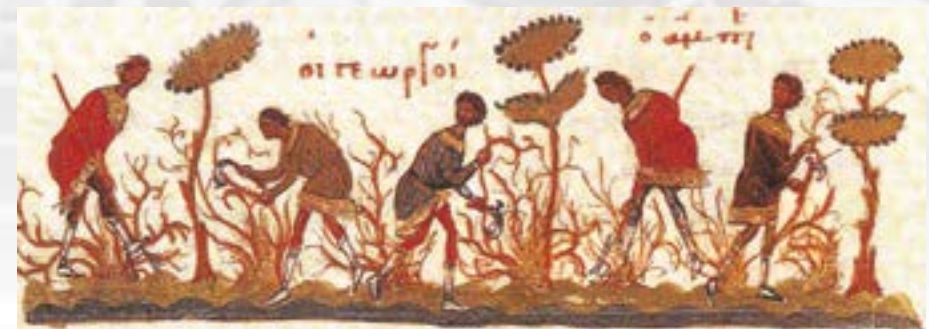
Η παραβολή της αμπέλου, μικρογραφία, Par. gr. 74 (μέσα 11ου αι.) Γ. Γαλάβαρης, Ελληνική τέχνη. Ζωγραφική βυζαντινών χειρογράφων, Αθήνα 1995, εικ. 67.

Οι πάροικοι συνιστούσαν το πιο παραγωγικό αγροτικό δυναμικό του κράτους και ήταν περιζήτητοι για την οργάνωση της παραγωγής, στην οποία στηριζόταν η επιβίωση της κοινωνικής πυραμίδας και η συντήρηση των φορέων του κρατικού μηχανισμού και του στρατού. Για τον λόγο αυτό το κράτος λάμβανε κατά καιρούς μέτρα που αποσκοπούσαν στην οικονομική ανακούφισή τους. Παράλληλα η περιορισμένη οικονομική δυνατότητα πρόσβασης στα μέσα παραγωγής επέβαλλε την οικονομική συνεργασία μεταξύ των αγροτών και τη λειτουργία του χωριού ως ενότητας, ιδιαίτέρως προκειμένου για την επίλυση προστριβών μεταξύ αγροτών και δωρεοδόχων. Η μεσολάβηση των πρωτογερόντων του χωριού υποδηλώνει την ύπαρξη κοινωνικής διαστρωμάτωσης και εντός της στενής πολλές φορές αγροτικής κοινότητας.