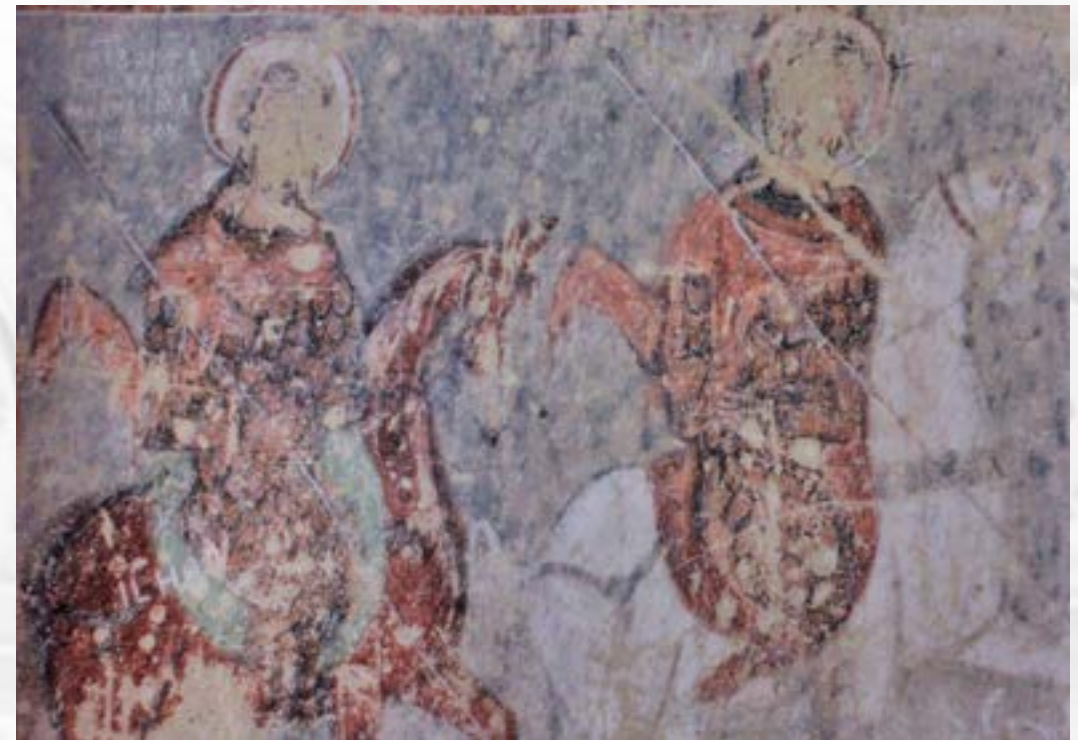
Ο αυτοκράτορας Ιωάννης Α΄ Τζιμισκής και ο μάγιστρος Μελίας, Ζανυσίν (Καππαδοκία), «Εκκλησία του Νικηφόρου Φωκά» (Μεγάλος Περιστερώνας)

Από το 985/986, όλοι οι επιφανείς εκπρόσωποι της στρατιωτικής αριστοκρατίας, ακόμη και οι μέχρι τότε νομιμόφρονες Μαλεΐνοι, ήταν εν δυνάμει αντιπολιτευόμενοι για τον καχύποπτο Βασίλειο Β΄, ο οποίος τήρησε απαρέγκλιτα την τακτική της απομάκρυνσης των «δυνατών» από τη Μ. Ασία, από όπου αντλούσαν την οικονομική και τη στρατιωτική ισχύ τους. Ο σκοπός επιτεύχθηκε, αλλά μόνο βραχυπρόθεσμα. Πεθαίνοντας, ο Βασίλειος Β΄ πίστευε ίσως ότι από τον αγώνα του εναντίον της επαρχιακής αριστοκρατίας είχε βγει νικητής. Όμως, ο πραγματικός ηττημένος δεν ήταν η αριστοκρατία, αλλά η δυναστεία του. Η Μακεδονική δυναστεία είχε εξολοθρευτεί μόνο την Καππαδοκική αριστοκρατία, το στήριγμα που η ίδια είχε επιμελώς δημιουργήσει.