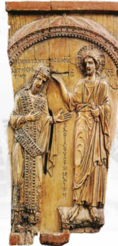
Ελεφαντοστέινη πλάκα: ο Χριστός στέφει τον Κωνσταντίνο Ζ΄ Πορφυρογέννητο (γύρω στο 945) Glory of Byzantium. Art and Culture of the Middle Byzantine Era, A.D. 843-1261, ed. H. Evans – W. Nixon, 1998, 203 εικ. 140.

Ο ι φορητές εικόνες ήδη από το τέλος της Εικονομαχίας αποτελούν αντικείμενο δημόσιας λατρείας και ιδιωτικής ευλάβειας. Σε αρκετές περιπτώσεις, ιδίως από τον 10ο αιώνα και εξής απαντούν παραδείγματα απεικονίσεων «κοσμικών» προσώπων. Σε κάποιες περιπτώσεις φαίνεται ότι υπάρχουν αντιστοιχίες με την εντοίχια ζωγραφική και την απεικόνιση δωρητών. Σε άλλες, ωστόσο, διαπιστώνεται ότι αναδεικνύεται περισσότερο η «βασιλική» ή άλλη ιδιότητα του απεικονιζόμενου, γιατί πρόκειται για προσωπογραφίες που έχουν παραγγελθεί από διαφορετικά πρόσωπα. Τα παραδείγματα που θα παρουσιαστούν κατά τη διάρκεια της μελέτης αυτής προέρχονται τόσο από ελεφαντοστέινες όσο και από γραπτές εικόνες. Η διαφοροποίηση των υλικών πιθανώς συνδέεται και με τις διαφορετικές οικονομικές δυνατότητες των παραγγελιοδοτών.