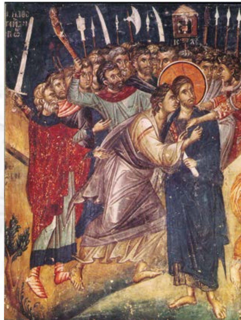
Τμήμα από την τοιχογραφία της προδοσίας, Άγιος Νικόλαος ο Ορφανός, Θεσσαλονίκη, 1310-1320

Η παρουσία του «δήμου» στις πηγές συνδέεται άμεσα με τις πόλεις και η δράση του τοποθετείται στον αστικό χώρο. Στην κοινωνική δομή των πόλεων ο «δήμος» καταλάμβανε έναν ευρύ χώρο, περιλαμβάνοντας το μεσαίο και το χαμηλότερο κοινωνικό στρώμα. Πληροφορίες από τις γραπτές μαρτυρίες αντλούμε για τη δράση του «δήμου» στην Κωνσταντινούπολη, στη Θεσσαλονίκη, στην Αδριανούπολη, στο Διδυμότειχο, στην Καλλίπολη, στην Ηράκλεια, στη Βιζύη, στη Βέροια, στην Έδεσσα, στην Άρτα. Σκοπός της παρούσας εργασίας είναι να παρουσιαστούν οι αντιλήψεις των Βυζαντινών για τον «δήμο» κατά τους τελευταίους αιώνες του Βυζαντίου. Στοιχεία παρέχουν κατά βάση οι ιστορικοί της εποχής, άνθρωποι κατά κύριο λόγο με υψηλές θέσεις στον κρατικό μηχανισμό και μέλη του ανώτερου κοινωνικού στρώματος. Το γεγονός αυτό καθιστά υποκειμενική την αντίληψή τους για την κοινωνική διαστρωμάτωση και δεν επιτρέπει να διαμορφώσουμε συνολική εικόνα σχετικά με τον «δήμο» και τη δράση του. Οι ιστορικοί του 13ου, 14ου και 15ου αιώνα αναγνωρίζουν τον θεσμικό ρόλο του «δήμου», τη συμμετοχή του στο συμβούλιο των πόλεων και στα κοινά. Κάθε φορά όμως που διαταράσσεται η καθεστηκία τάξη, την οποία οι ίδιοι εκπροσωπούν, και ο «δήμος» αναλαμβάνει ανατρεπτική δράση, όπως συνέβη κυρίως στα χρόνια της δεύτερης εμφύλιας διαμάχης του 14ου αιώνα, τότε χρησιμοποιούν μελανά χρώματα για να τον χαρακτηρίσουν.