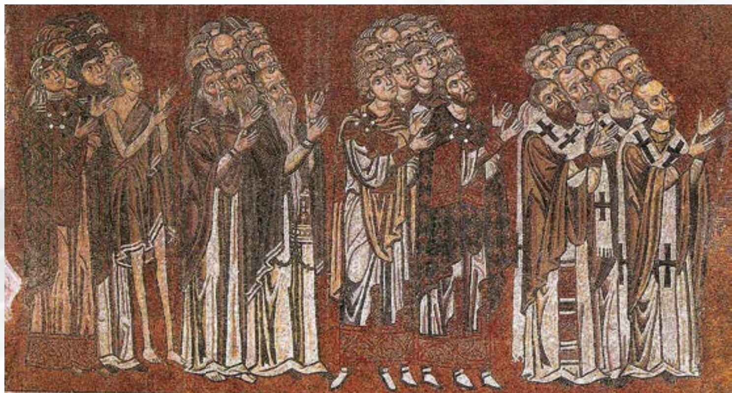
Οι δίκαιοι στον παράδεισο: κληρικοί, αξιωματούχοι, μοναχοί και άγιες γυναίκες, Santa Maria Assunta, Βενετία, Torsello (αρχές 12ου αι.) N. Χατζηδάκη, Ελληνική τέχνη. Βυζαντινά ψηφιδωτά, Αθήνα 1994, εικ. 150.

À première vue, contrairement à l'Occident médiéval, il n'existe pas à Byzance une théorie clairement identifiable de la société énoncée par l'Église : on ne trouve pas dans les écrits émanant d'ecclésiastiques un modèle interprétatif global en termes d'organisation du corps social. Un premier principe domine le discours ecclésial, celui de la séparation radicale entre les chrétiens – ceux qui appartiennent à l'Église et qui sont donc «inclus» – et les personnes extérieures à l'Église, les non-chrétiens, hérétiques, mais aussi les excommuniés. Au-delà de cette première distinction, le discours spécifique de l'Église sur la société chrétienne est à rechercher du côté de l'œuvre fondamentale du Pseudo-Denys l'Aréopagite et de ses commentateurs ultérieurs : les interprétations données à Byzance à la Hiérarchie ecclésiastique offrent une ébauche de théorisation et de conception organisée de la société chrétienne.