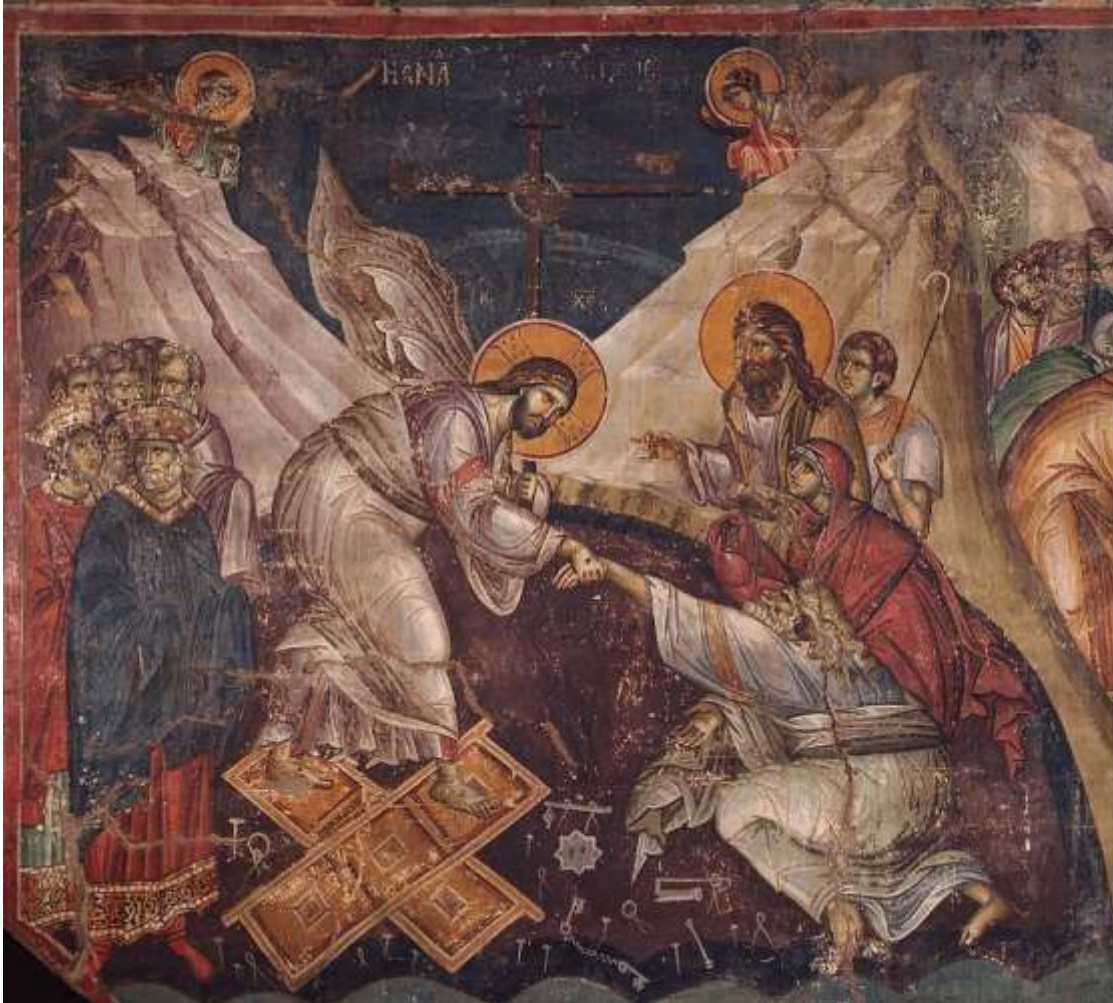
Η εικόνα της Ανάστασης του Χριστού («εις Άδου κάθοδος» Μαν. Πανσέληνου, Πρωτάτο Αγίου Όρους)