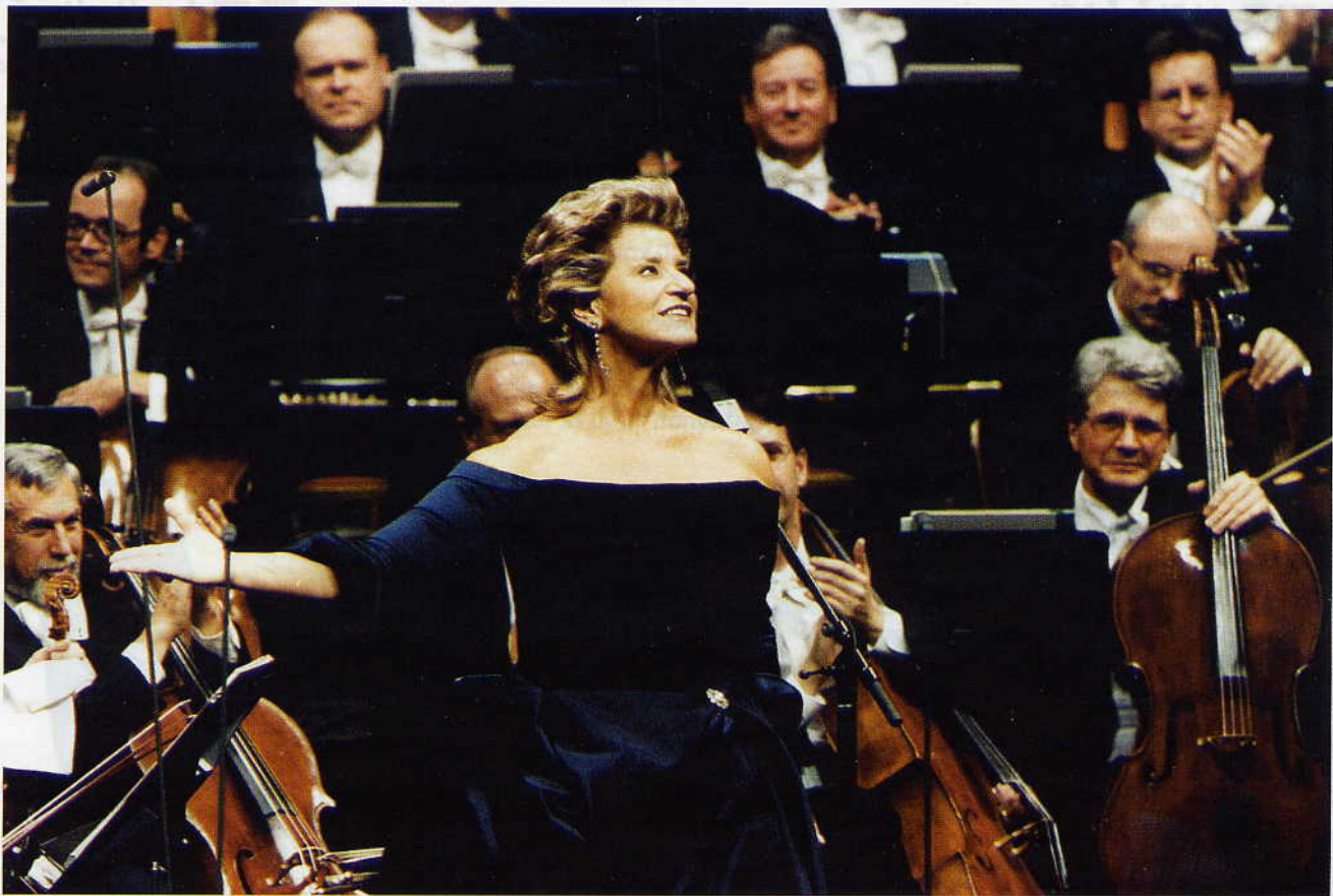
ΚΡΑΤΙΚΗ ΟΠΕΡΑ της Βιέννης, Νοέμβριος 2005