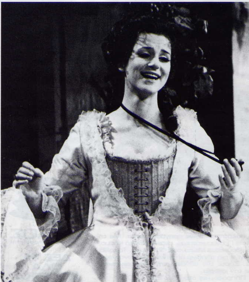
ΩΣ ΝΤΟΡΑΜΠΕΛΑ στο «Ετσι κάνουν όλες», το 1981

- Όπως είπε κι ο Βισκόντι στον Τσαρούχη κάποτε, «ας μη λέγονται τέτοια πράγματα μεταξύ Ελλήνων»... Κι η Ελλάδα, που την επισκέπτεστε αρκετά συχνά μεν αλλά ως κάτοικος εξωτερικού, πώς σας φαίνεται, πώς σας μοιάζει; Γιατί εμείς οι εδώ νιώθουμε έντονα την πνευματική, και όχι μόνο, εγχώρια δυσκολία. «Κατ' αρχάς, εγώ βλέπω πρώτα τα καλά, τις βελτιώσεις της Ελλάδας, μια και λείπω. Να, τώρα, δεν μπορώ να πιστέψω πως βρισκόμαστε σ' ένα τέτοιο κτίριο, κι ετοιμαζόμαστε να ανεβάσουμε μια "Ηλέκτρα" με τέτοιες προδιαγραφές. Σε μέγαφα πια υπερσύγχρονα, όχι σε ένα μόνο Μέγαρο. Πραγματικά, δεν μπορώ να το πιστέψω».