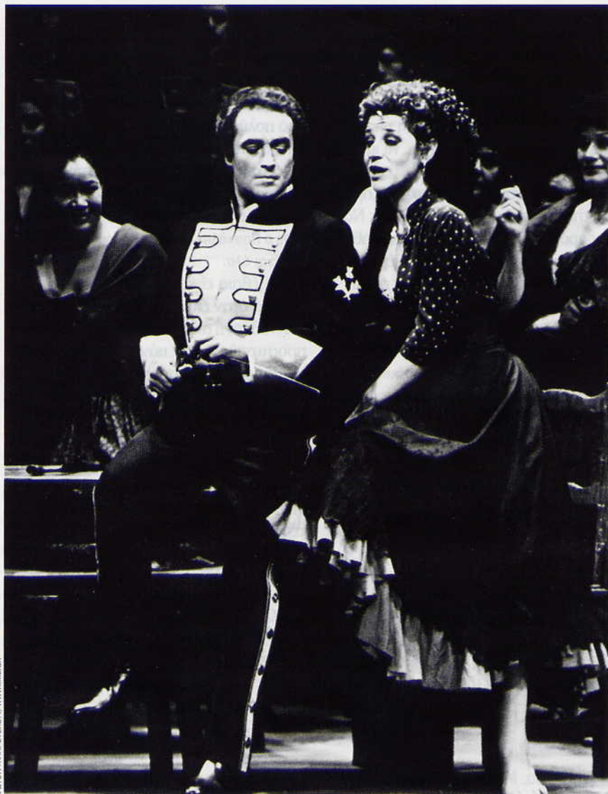
ΣΤΗΝ «ΚΑΡΜΕΝ», με τον Χοσέ Καρέρας, το 1987

«Η μεγάλη Μαρία Κάλλας “κατέστρεψε” πολλές, φοβάμαι. Ξέρετε πόσες νέες Μαρίες Κάλλας έχουν βγει από την Κάλλας ως σήμερα;»