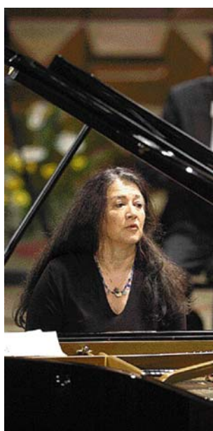
Η Μάρτα Αργκεριχ θα πραγματοποιήσει μία και μοναδική εμφάνιση στην Αθήνα

Η πρώτη επαφή της κορυφαίας σήμερα ερμηνεύτριας με το πιάνο οφείλεται σε ένα... παιδικό πείσμα. Ήταν μόλις δύο ετών η Μάρτα Αργκεριχ όταν κάποιος λίγο μεγαλύτερος σύντροφός της στο παιχνίδι την «προκάλεσε» λέγοντάς της πως δεν μπορεί να παίζει πιάνο γιατί είναι μικρή. Εκείνη κατευθύνθηκε τότε προς το όργανο που διέθετε ο παιδικός σταθμός και έπαιξε με το ένα δάχτυλο το τραγούδι που είχε μόλις ακούσει από την παιδαγωγό της. Έκτοτε τα πράγματα πήραν τον δρόμο τους, αν και, όπως εξομολογούνταν η ίδια πολύ αργότερα, το στοιχείο αυτό του χαρακτήρα της, η επιθυμία της δηλαδή να αποδείξει ότι μπορεί να κάνει κάτι, δεν την εγκατέλειψε ποτέ. «Ακόμη και σήμερα αυτός είναι ο τρόπος που αντιδρώ στις προκλήσεις» δήλωνε χαρακτηριστικά, για να συνεχίσει αμέσως μετά: «Πολλές φορές πιάνω τον εαυτό μου κυριολεκτικά να υποφέρει προκειμένου μόνο και μόνο να αποδείξω ότι είμαι ικανή να κάνω κάτι. Και αναρωτιέμαι για ποιον λόγο. Έχει άραγε νόημα να ανεχόμαστε κάτι που μας βασανίζει;» .