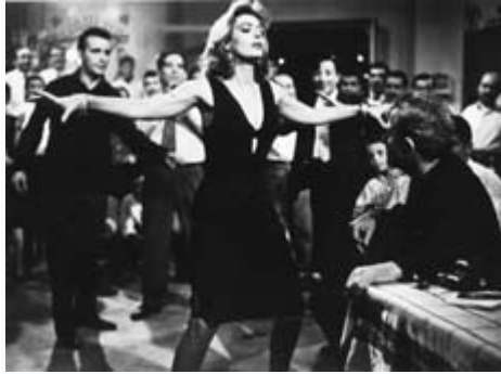
Η Μελίνα Μερκούρη στην ταινία Ποτέ την Κυριακή

Το κινηματογραφικό της ντεμπούτο έγινε με ένα θεατρικό έργο που είχε γραφτεί από τον Ιάκωβο Καμπανέλλη ειδικά για τη Μελίνα Μερκούρη, το "Στέλλα με τα κόκκινα γάντια", που στην ταινία είχε τον τίτλο "Στέλλα" (1955). Η ταινία αυτή ήταν η μόνη που έκανε η Μελίνα Μερκούρη με ελληνική παραγωγή.