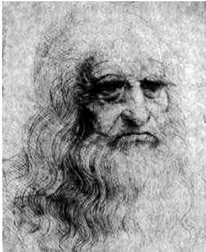
Ο Αναγεννησιακός σοφός