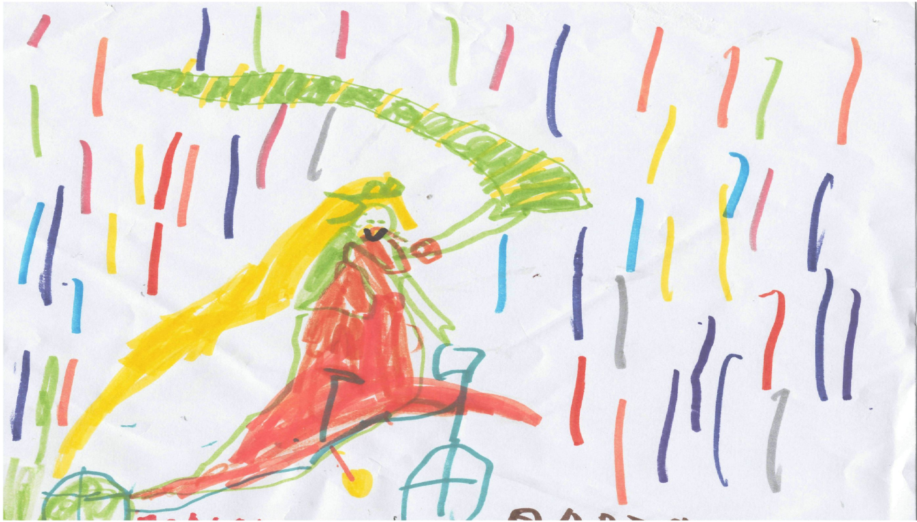
Ζωγραφιά της Α.Σ